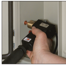
Anwendungsbeispiel Schaltschrankbau Example of use Switchboard construction